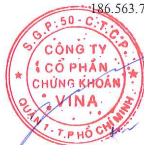
Nghiêm Xuân Huy Chủ tịch Hội đồng quản trị