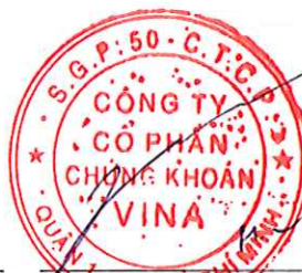
Nghiêm Xuân Huy Chủ tịch Hội đồng quản trị Hà Nội, ngày 28 tháng 07 năm 2022