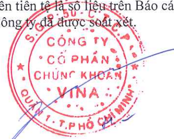
Nghiêm Xuân Huy Chủ tịch Hội đồng quản trị