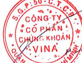
Nghiêm Xuân Huy Chủ tịch Hội đồng quản trị Hà Nội, ngày 28 tháng 07 năm 2022