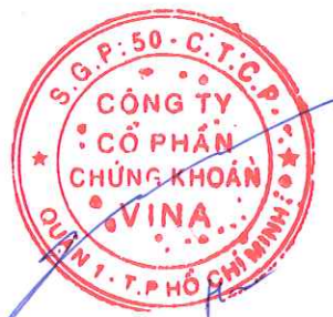
Nghiêm Xuân Huy Chủ tịch Hội đồng quản trị Hà Nội, ngày 28 tháng 07 năm 2022